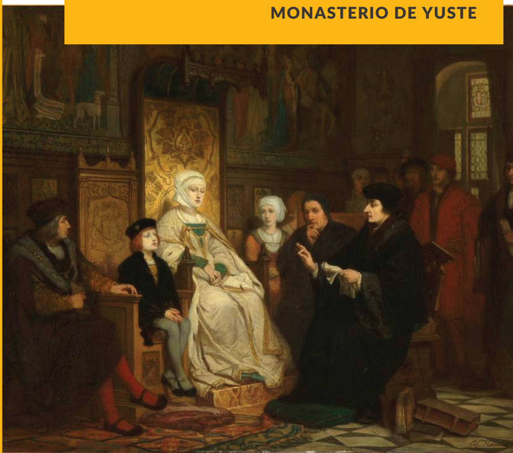
ERASMO DA UNA CLASE A CARLOS V NIÑO, POR E-J. HAMMAN OLEO SOBRE LIENZO - MUSEO DE ORSAY