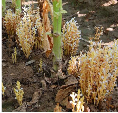
Planta de tabaco con ataque de jopo