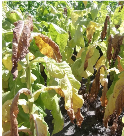
Daño ocasionado por jopo en parcela con ataque grave

Es fundamental tener información de todas las parcelas afectadas por jopo, con vistas a un mejor control de este parásito. Por tanto, si se observan las primeras plantas se agradecería que informen al Técnico que visite su parcela.