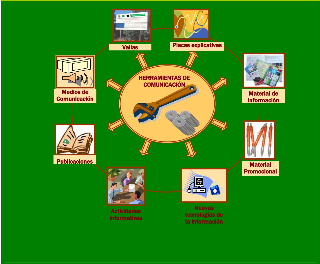
Esquema 1. Los instrumentos de información del Plan de Información y Publicidad del PDR FEADER 2007-2013 de Extremadura

Todas las medidas de Información y Publicidad dirigidas a los Beneficiarios Potenciales, Beneficiarios y al Público en General a través de las herramientas de comunicación tienen incluirán los elementos recogidos en el apartado 3., del anexo VI, del Reglamento 1974/2006.