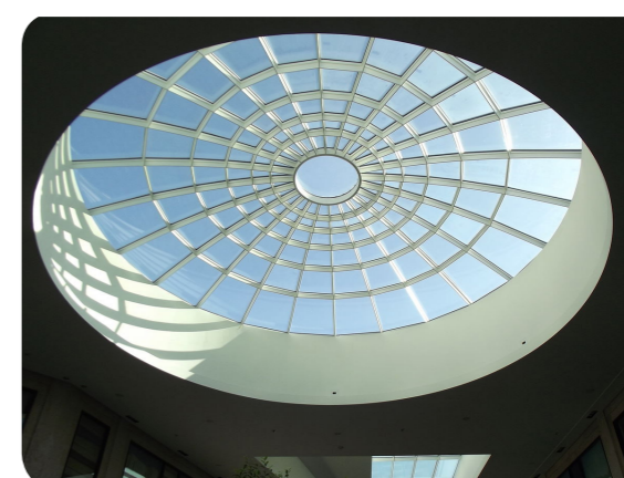
Imagen de un lucernario

Hueco o ventana que se crea en el techo o en la parte alta de una pared, para que entre luz y se pueda ventilar.