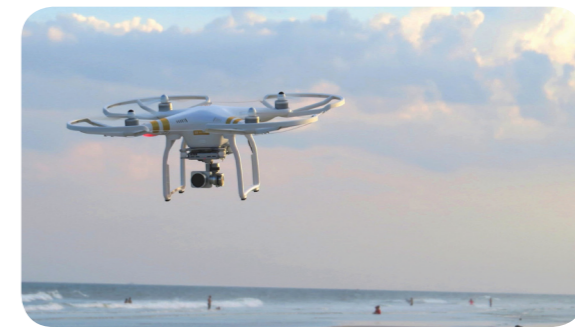
Imagen de Dron

Drones: Aeronaves no tripuladas, es decir, vehículo que se desplaza por el aire y que se controla a distancia sin que nadie lo conduzca o pilote.