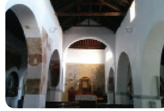
Imagen del interior de la iglesia (Autor José Sánchez)

Se declaran así a los bienes que por su importancia social o histórica necesitan ser protegidos.