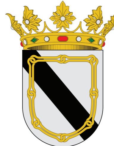
Imagen Blason de los Zúñiga

Representación gráfica, generalmente con forma de escudo, con símbolos y figuras que representan a los antepasados de la familia de los Zúñiga, una familia noble que descendía de los Reyes de Navarra de la Casa Iñiga.