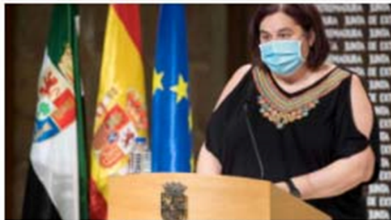
Begoña García, consejera de Agricultura extremeña.