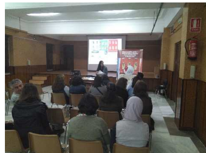
Jornada de Cabeza del Buey