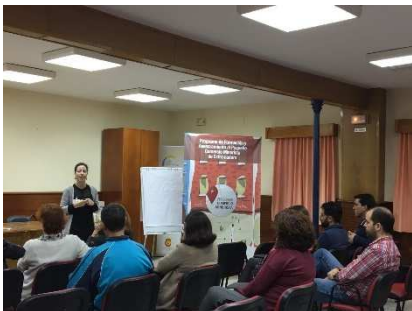
Jornada de Monesterio