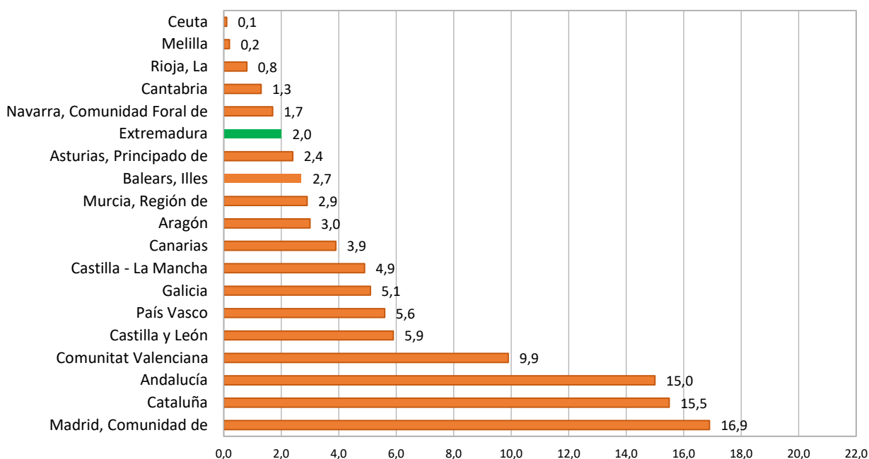
Porcentaje de viajes de los residentes en España según CA de destino. Cuarto trimestre 2025