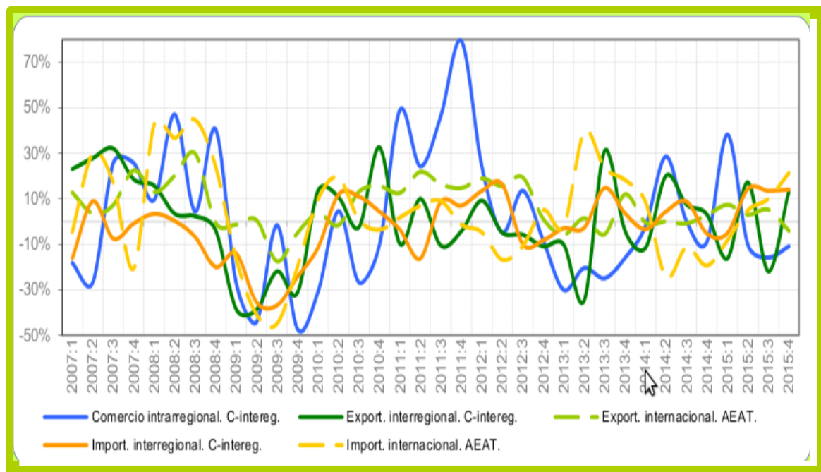
Gráfico del comercio interior de Extremadura y otros indicadores (Tasas interanuales)