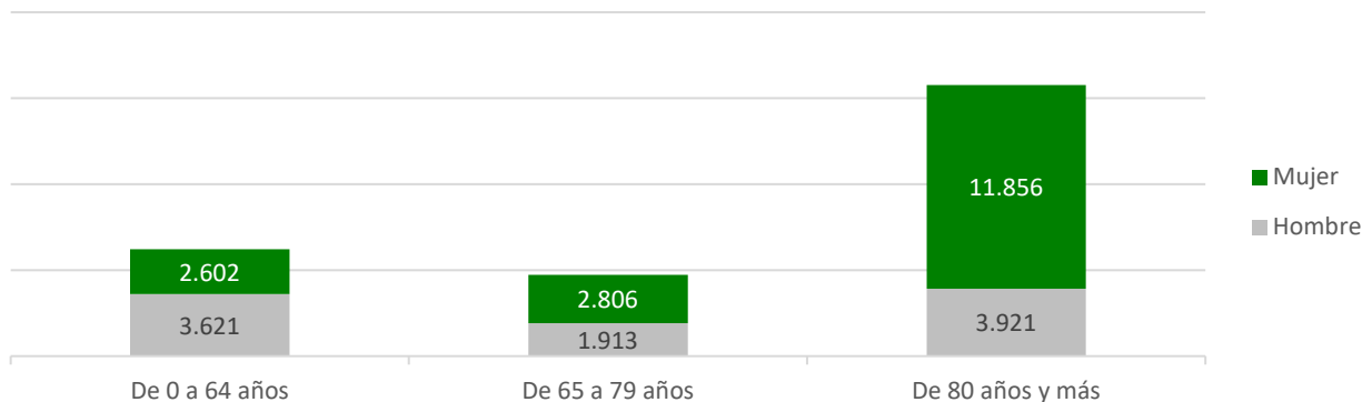
Resoluciones de Grado II y Grado III por sexo y tramos de edad. Extremadura